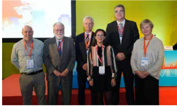
Participantes en la Reunión Post-ISTH.

E l factor plaquetario 4 (PF4) fue uno de los protagonistas del último Congreso de la Sociedad Internacional de Trombosis y Hemostasia (ISHT), que recientemente se ha llevado a cabo en Montreal (Canadá). Así se ha reflejado en la reunión Post-Congreso ISTH 2023, celebrada ayer miércoles en el Palacio de Congresos de Sevilla.