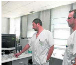
Dos de sus colaboradores en Hematología del Juan Ramón.

Por otra parte, es coautor junto a hematólogos de este centro sanitario de numerosas