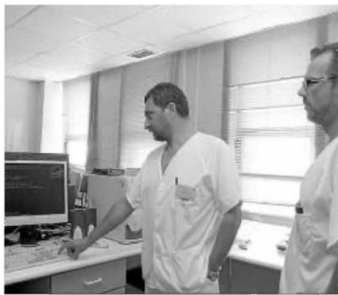
Dos de sus colaboradores en Hematología del Juan Ramón.