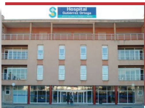
Hospital Gutiérrez Ortega de Valdepeñas